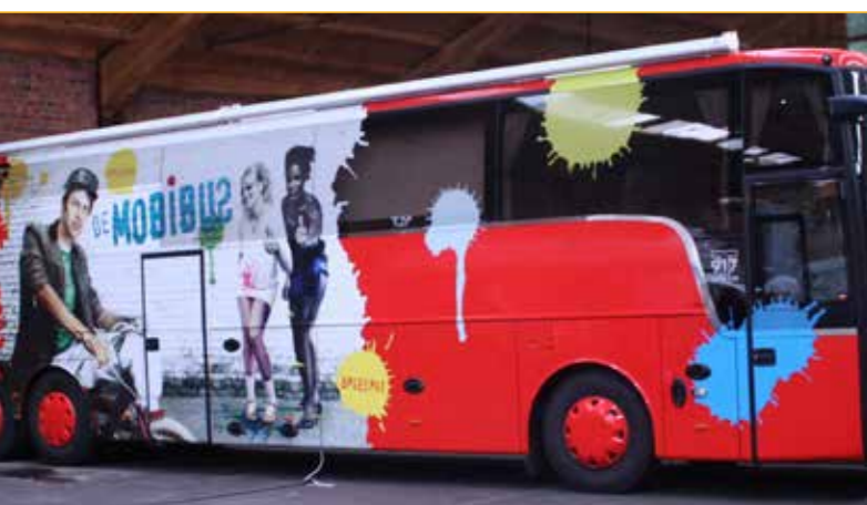
De Mobibus informeert jongeren over het verkeer

Dagelijks worden we via het nieuws geconfronteerd met verkeersongevallen. Daar zijn helaas dikwijls jongeren bij betrokken. Kristof Van de Velde, schepen van Onderwijs, Jeugd en Verenigingen: "In samenwerking met de plaatselijke scholen hebben we via twee projecten geprobeerd om de jongeren bewust te maken van de gevaren in het verkeer."