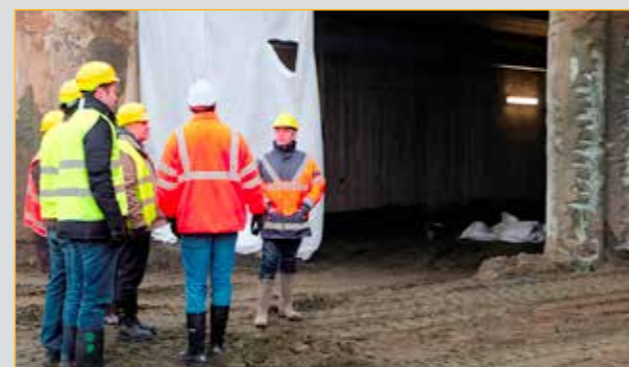
De werken aan de ondertunneling schieten goed op

Om te beantwoorden aan de nieuwe Europese regelgeving qua veiligheid van vliegvelden, moest de R11 ondertunneld worden. Indien dit niet gebeurt, is er geen veilige uitloopzone. Deze RESA-zone (runway and safety area) ligt tussen het einde van de startbaan en Fort 3.