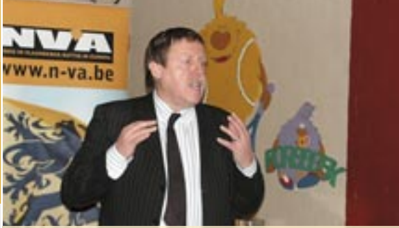
Kamerlid Siegfried Bracke kruidde zijn relaas over de onderhandelingen met enkele pittige anekdotes.