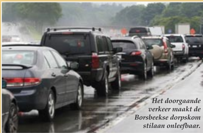
Het doorgaande verkeer maakt de Borsbeekse dorpskom stilaan onleefbaar.