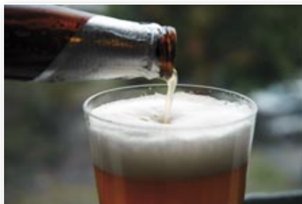
N-VA Borsbeek staat op de jaarmarkt. Kom gerust langs voor een frisse pint en een verkwikkende babbel!

Ook dit jaar is de N-VA van de partij. Mensen die meer willen weten over de N-VA, die goede ideeën hebben over Borsbeek, die een praatje willen slaan met een van onze parlementsleden of die gewoon wat verkoeling zoeken bij een frisse pint zijn dus meer dan welkom aan ons standje.